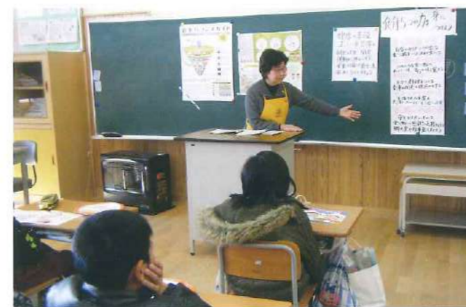
小学生対象食育教室での講義の様子