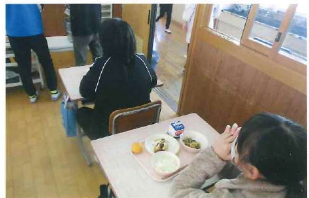
給食時間の様子 (周参見小学校)