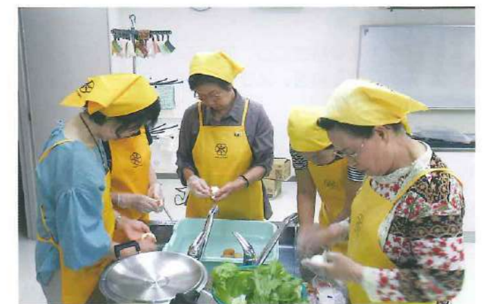
高齢者対象生活習慣病予防教室での調理実習の様子