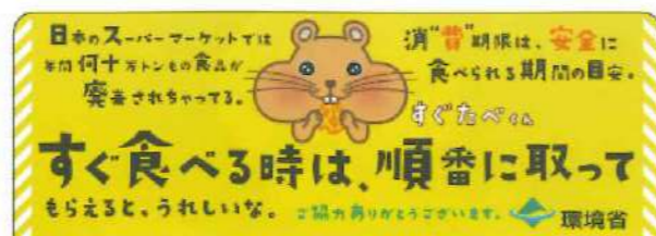
賞味期限と消費期限のちがい