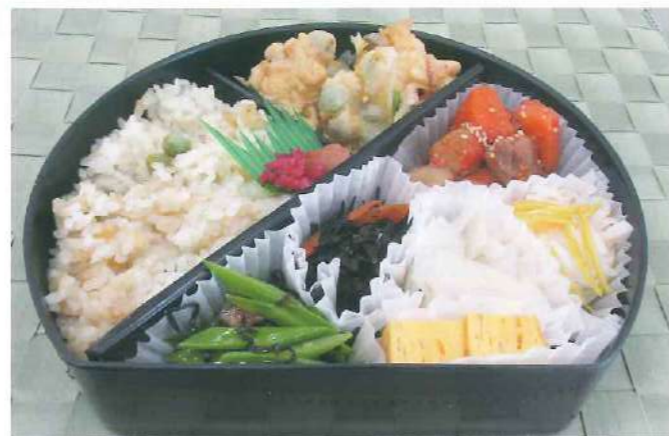
地元産食材たっぷりのお弁当